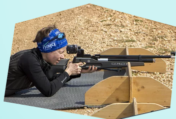
Tir à la carabine